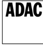
ADAC Niedersachsen Sachsen-Anhalt e.V.